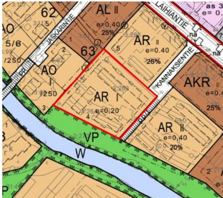
Kuva 3. Ote asemakaavayhdistelmästä.