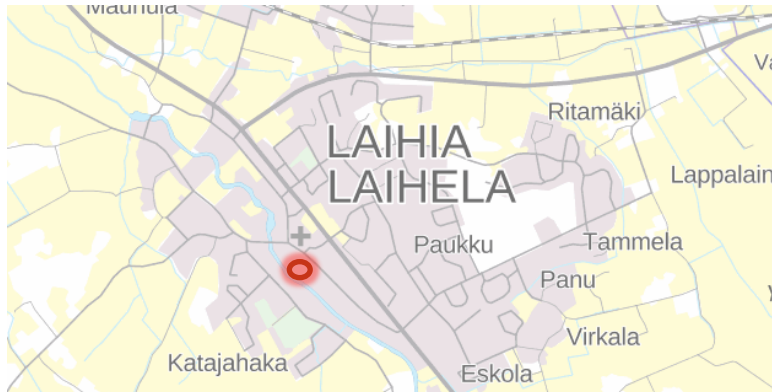
Kuva 1. Suunnittelualueen sijainti Laihian keskustassa. Taustakartta © Maanmittauslaitos.

Kaavan vaikutusalue ulottuu suunnittelualueen lähiympäristöön.